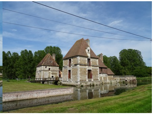
Les pavillons d'angle du manoir