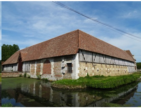
Les communs et leurs douves