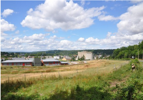
Une vue générale de Beaumont-le-Roger

Les avis seront cohérents avec ceux émis ces dernières années, à savoir : pas de maisons à volume compliqué (type V, W, Y, ou Z), Rez-de-chaussée + Combles, pentes à 45° pour les volumes principaux, ardoise ou tuile plate de teinte brun vieilli, à 20u/m 2 , avec un débord de toiture de 20cm, enduit de teinte beige clair avec modénatures (au choix : chaînages, encadrement de fenêtres, soubassement, colombage...). *Voir autres fiches.