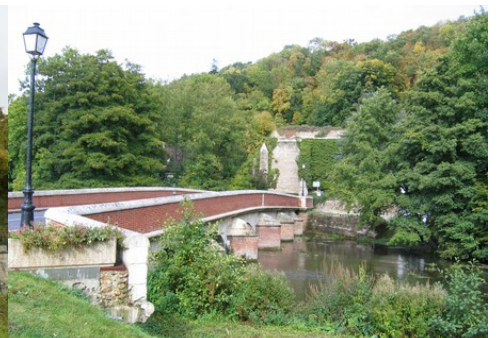
Un pont sur la Risle