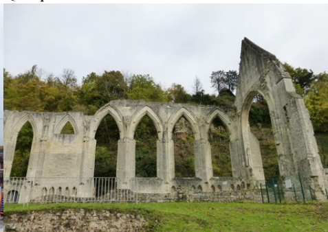
Les vestiges du prieuré de Beaumont