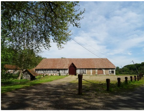
Les communs vus de la route