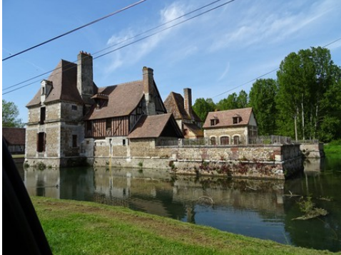
Les vestiges de l'aile Sud