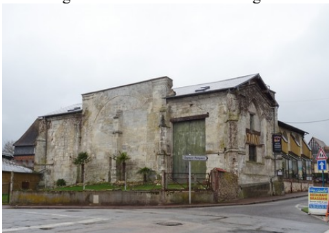
Une ancienne église transformée