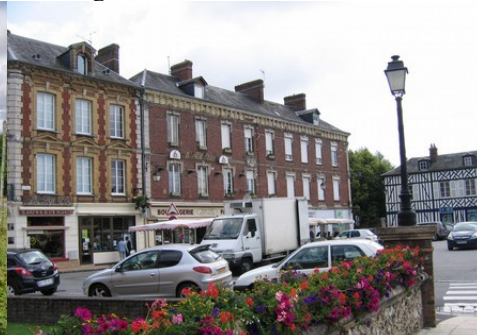
Quelques maisons en centre-ville